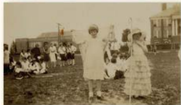
Alumnos en frente de la anterior Escuela Bennett (la que hoy día es un sitio histórico en la avenida Lee) con la anterior Escuela Secundaria Manassas en el fondo.